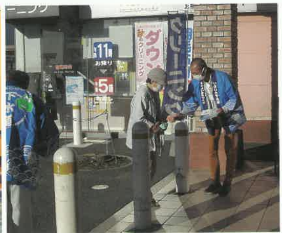
「下水道の日」街頭キャンペーン