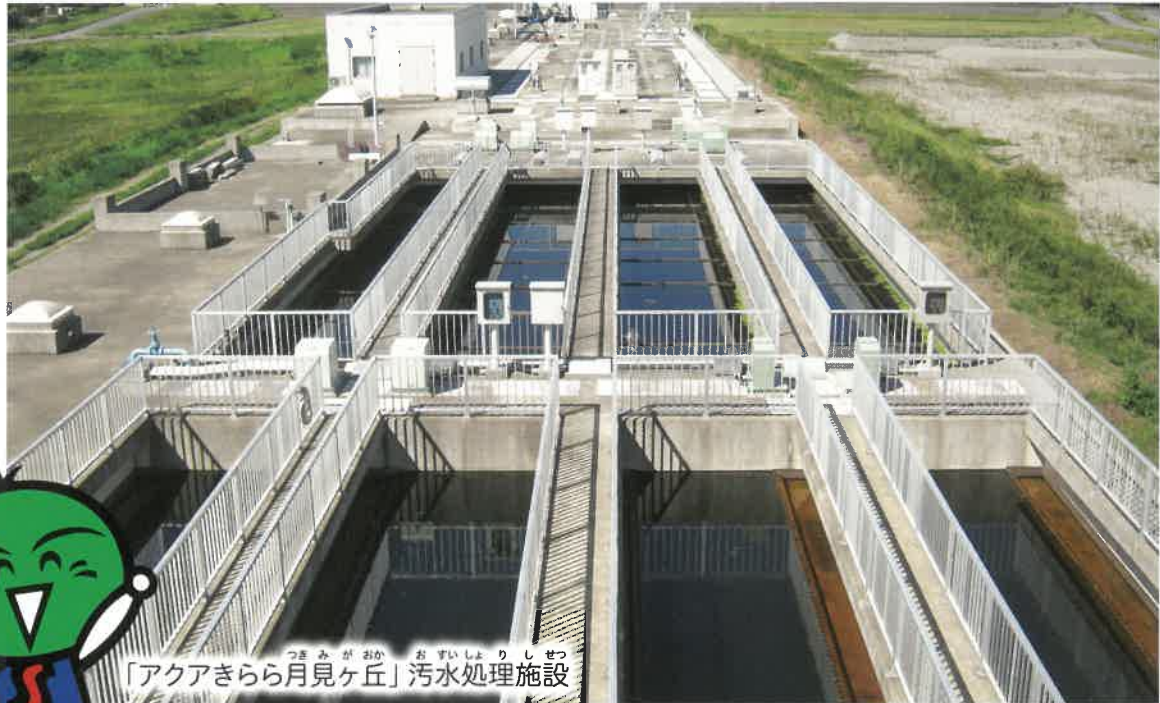
「アクアきらら月見ヶ丘」污水处理施設