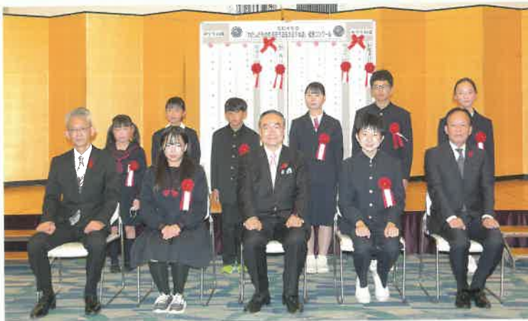
「わたしたちの生活を守る支える下水道」標語コンクール